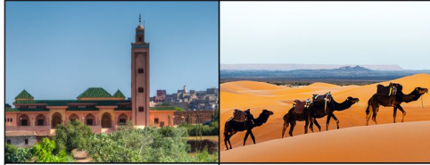
La Mosquée Hassan II à Casablanca