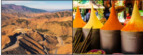
Les Montagnes de L'Atlas