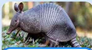
un armadillo an armadillo