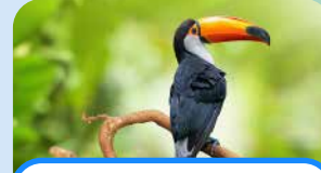
un tucán a toucan