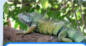
una iguana an iguana