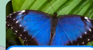
una mariposa a butterfly