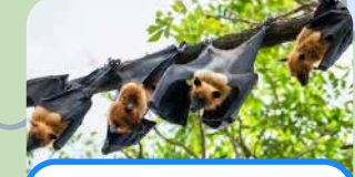
un murciélago a bat