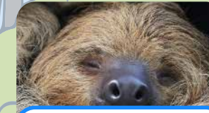
un perezoso a sloth