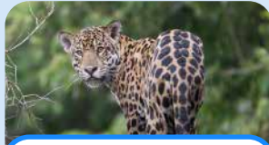
un jaguar a jaguar