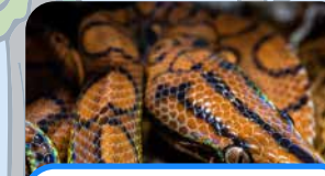
una serpiente a snake